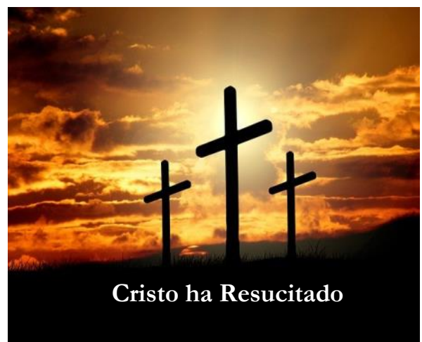
Cristo ha Resucitado

Happy Easter from the staff at St. Juan Diego!